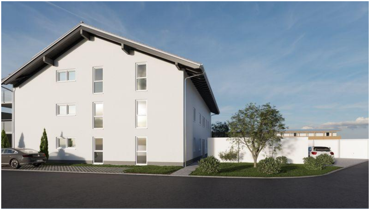
Ostansicht vom Wohnhaus mit insgesamt 9 Wohnungen