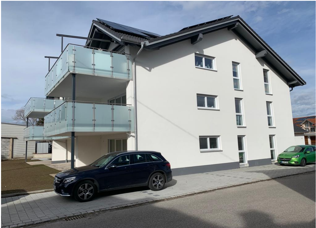
Ostansicht vom Wohnhaus mit insgesamt 9 Wohnungen